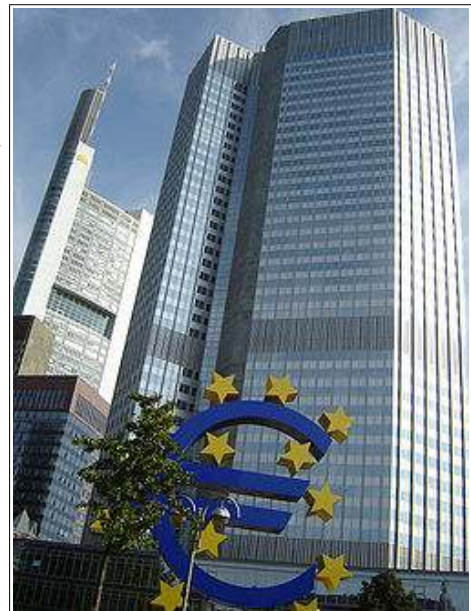
프랑크푸르트의 ECB 건물로 유로타워라고도 불린다

어찌됐든 출범한 EMU의 주도권은 유럽지역 최강의 경제력을 가지고 있는 독일에 게 돌아갔고, 당연히 독일의 입장에서 통화정책을 펼쳐나가게 된다. 이런 강대국 중심의 통화정책이 EMU에 가입한 약소국들에게는 큰 도움이 되었다. 먼저 유로화의 가치가 안정세를 보임에 따라 외환거래의 위험이 줄어들었고, 유럽 경제의 통합으로 인해 시장도 넓어졌다. 그리고 독일 등 선진국 경제 중심으로 맞추어진 기준금리는 아일랜드, 포르투갈, 그리스 등 높은 성장률을 보이는 신흥국들에게는 너무 낮은 수준이기 때문에 이들 국가의 경제를 부양하는 효과를 발생시키게 되었다. 이런 연유로 EMU 출범 이후 유로화의 위치가 상승하는 것은 물론, EMU에 가입한 나라들은 이전보다 고성장을 거두게 되었다.